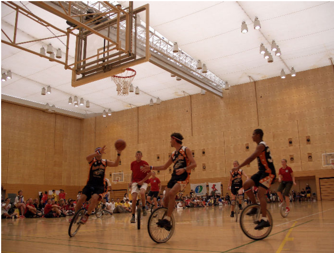
Finale du tournoi de basket, contre le Danemark à Tokyo (Unicon XII, 2004) Victoire sur le score de 80 à 20 pour les Portoricains

environs une fois par semaine pour pratiquer avec d'autres monocyclistes.