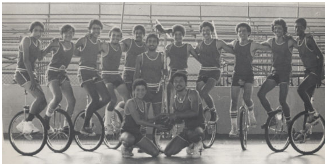
Club de monocycle d'Isabela pratiquant dans les années 1970

retrouvent de temps en temps. Ces derniers temps, je fais la route jusqu'à Isabela (Ouest) ou Rio Grande (Est)